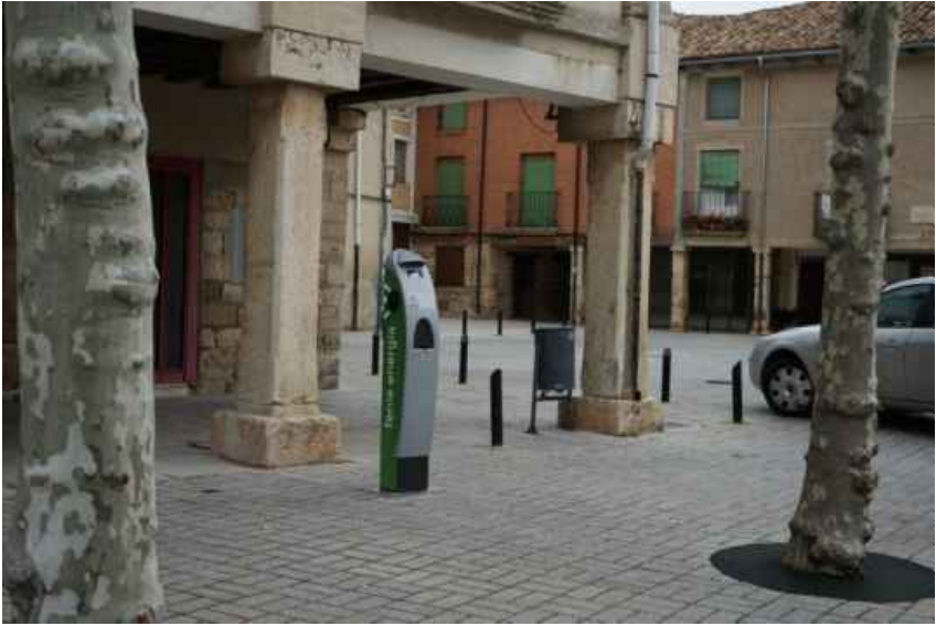
PUNTO DE CARGA PARA VEHICULOS ELECTRICOS